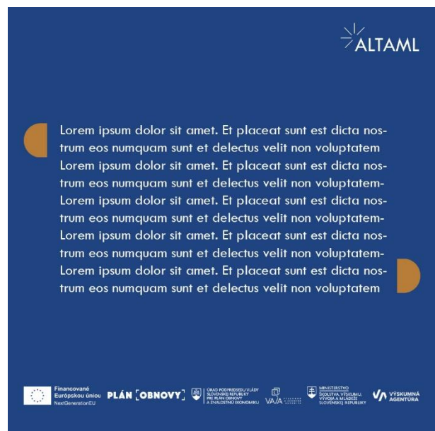
Vzor príspevku na sociálne sieti č. 5: